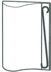
クーヴルパネル 1枚