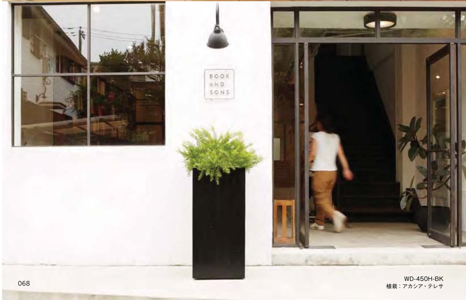
WD-450H-BK 植栽：アカシア・テレサ