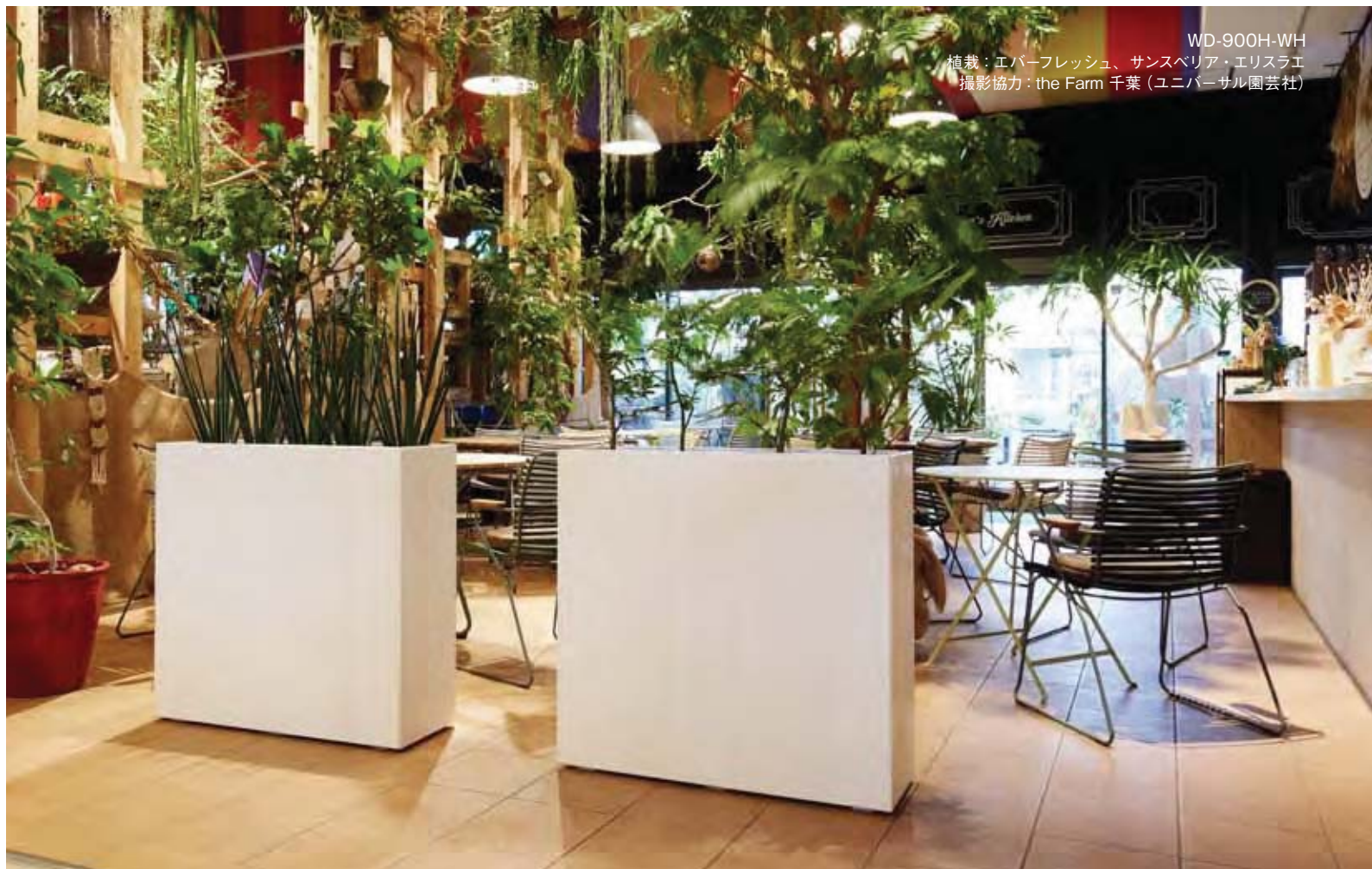
WD-900H-WH 植栽：エバーフレッシュ、サンスベリア・エリスラエ