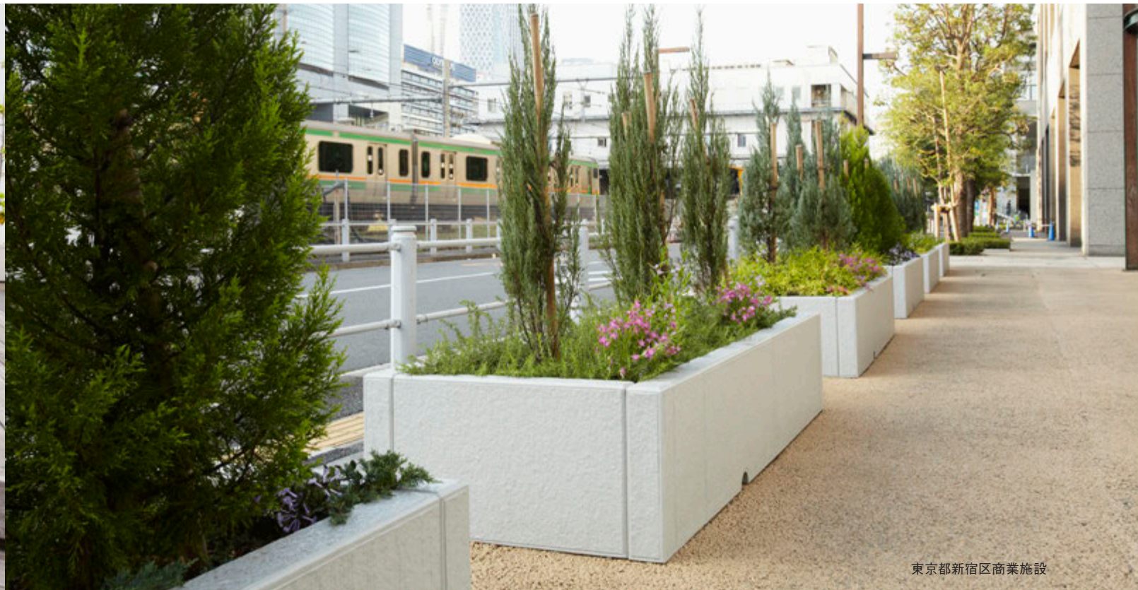
東京都新宿区商業施設