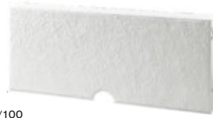
基本パネル (排水口付)