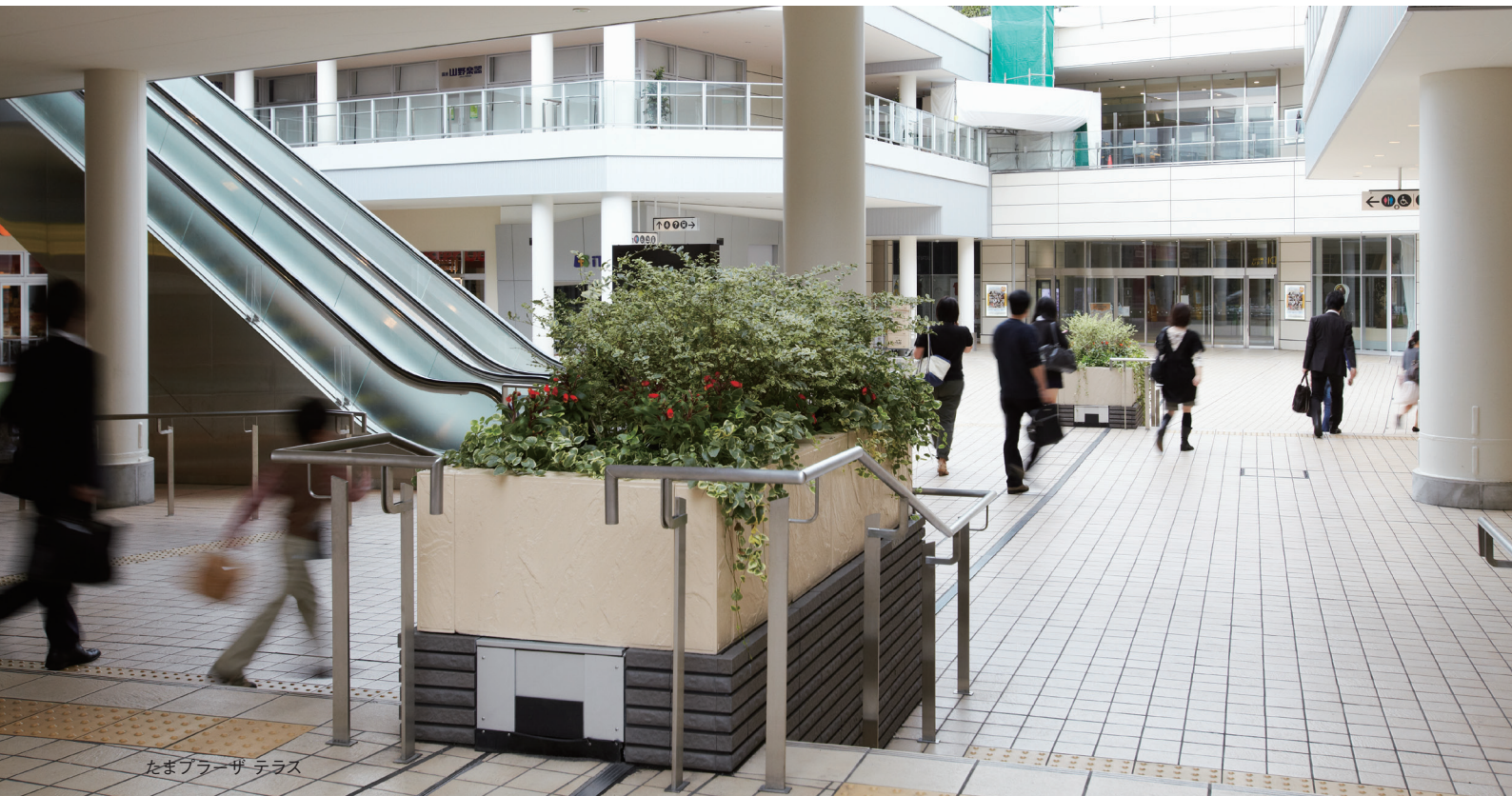
たまブラザー テラス