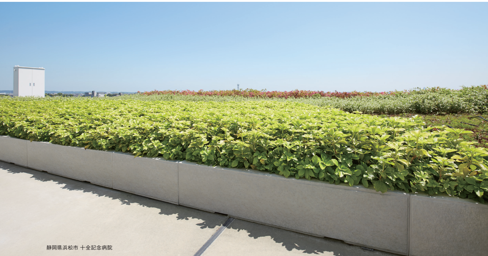
静岡県浜松市 十全記念病院