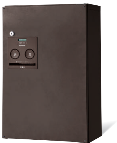
CTNR4030RMA (エイジングブラウン)

「使用中 (赤色)」表示の場合、付属の専用キーでシリンダー錠※3を回し、扉を開けます。 荷物を取り出し、扉を閉めます。「使用中 (赤色)」の表示が「受け取れます (緑色)」に戻っているか確認します。