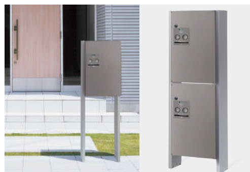
宅配ポスト CTNR4030RSC / ポール CTNR8220CS (ステンシルバー) (ケールシルバー)

※錠付商品は防犯性に工夫を施しておりますが、侵入・盗難を確実に阻止する商品ではありません。発生した損害については責任を負いかねますのでご了承ください。