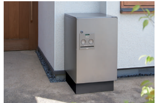
宅配ポスト CTNR4020RSC / 施工用ベース CTNR8120TB (ステンシルパー) (铸铁ブラック)

※錠付商品は防犯性に工夫を施しておりますが、侵入・盗難を確実に阻止する商品ではありません。発生した損害については責任を負いかねますのでご了承ください。