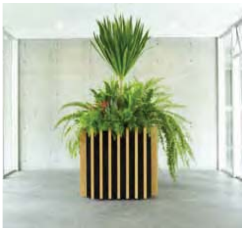
見る角度により、地色の見え方に変化が付き見た目の印象が変わります。

板厚 10mm の FRP 製特殊ハニカムパネルを使用。 軽量性と高剛性を両立したプランターです。 屋上・テラス・デッキなど設置場所が広がります。